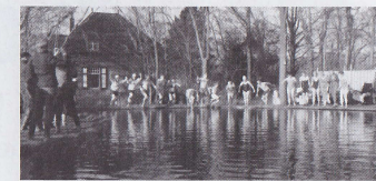
De buitentemperatuur was 7 graden pag. 7