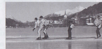
Techniek! Daar draait het om pag. 9