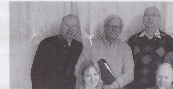
'We moeten het met z'n allen doen!' pag. 5