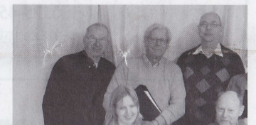
'We moeten het met z'n allen doen!'